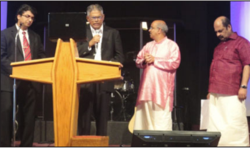
2012 Sharon Family Conference Website Inauguration