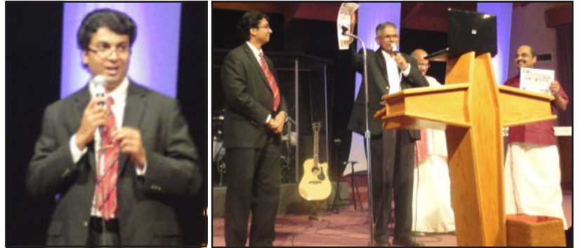
2012 Family Conference Newsletter Inauguration