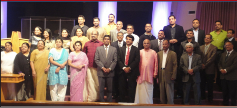
2012 Sharon Family Conference acommittee